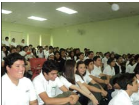
Alumnos del Instituto bilingüe Del Campo School, durante la presentación de la versión juvenil del INDH 2008/2009.