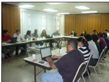
El Equipo de la UPE al momento del proceso de consulta a RR, RRA y los colegas del PNUD sobre los temas centrales del Informe Nacional sobre Desarrollo Humano (INDH) 2010/2011.