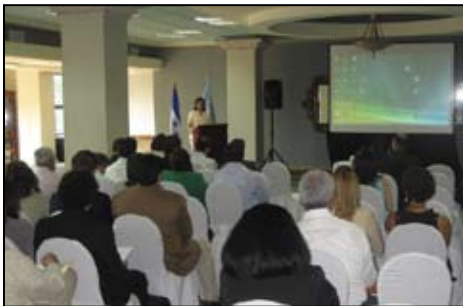
La Designada Presidencial María Antonieta de Bográn al momento de dirigir las palabras de bienvenida en el taller de trabajo "Plan de Nación y los Objetivos de Desarrollo del Milenio".

conformado 19 mesas de trabajo, cada una dedicada al estudio de una o dos Metas del Milenio (MDM). En esta primera reunión plenaria los miembros de cada mesa de trabajo definieron los próximos pasos a seguir en la elaboración del IDOM 2010.