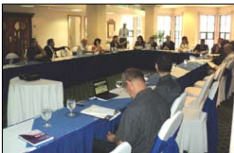
Vista parcial de la primera reunión del Consejo Asesor del Informe Nacional sobre Desarrollo Humano Honduras 2010/2011.