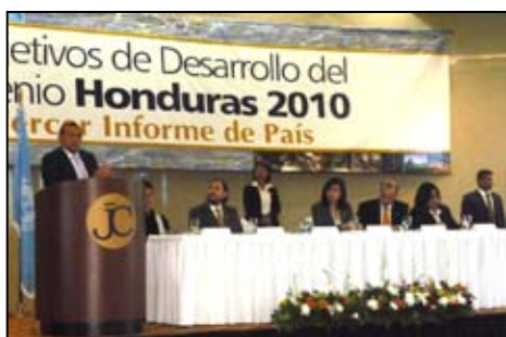
El Presidente de la República, Porfirio Lobo Sosa, mientras se dirige al público asistente a la presentación del Tercer Informe de País sobre los Objetivos de Desarrollo del Milenio (IODM) 2010 en Tegucigalpa.