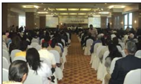
Vista parcial de los asistentes a la presentación del Tercer Informe de País sobre los Objetivos de Desarrollo del Milenio (IODM) 2010 en Tegucigalpa.