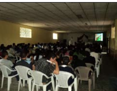
Vista parcial de los asistentes a la presentación el INDH 2008/2009 en La Labor, Ocotepeque.

privado, cooperantes, centros educativos de distintos niveles, ONGs, organizaciones juveniles, autoridades de gobiernos locales Asimismo, se contó con la representación de diferentes instituciones y sectores representativos del país. A continuación se puede observar la agenda de las presentaciones realizadas y el número de participantes.