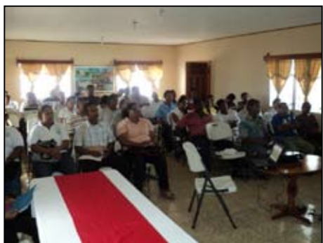
Vista parcial de los asistentes a la presentación el INDH 2008/2009 en Puerto Lempira, Gracias a Dios.