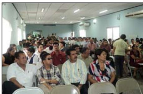
Vista parcial de los asistentes a la presentación el INDH 2008/2009 en Choluteca, Choluteca.