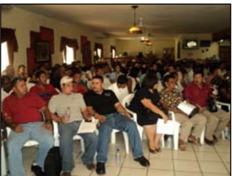
Vista parcial de los asistentes a la presentación el INDH 2008/2009 en Roatán, Islas de la Bahía.